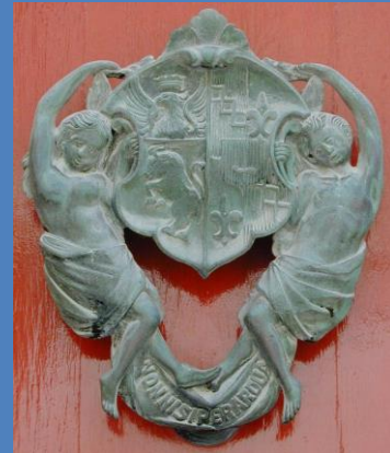
In Mdina (Malta) entdeckter schöner alter Türklopfen mit Wappen

Der Antragsteller trägt gegenüber den Wappenrollen die Beweislast, dass ihm die Führungsberechtigung an dem vorgelegten alten Wappen zusteht. Die Führungsberechtigung muss jederzeit und lückenlos nachgewiesen werden können. Für den familienkundlichen Nachweis kann dabei Hilfe bei den genealogischen Vereinen im In- und Ausland gefunden werden.